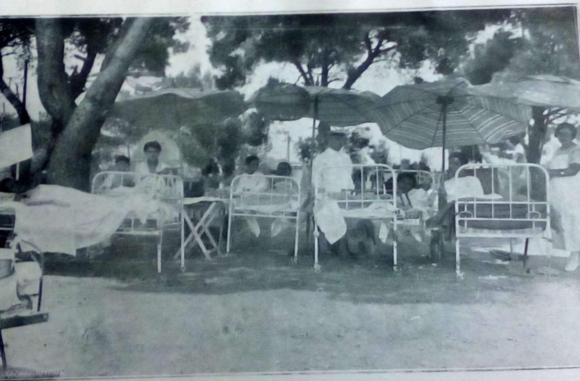
Παραθαλάσσιον Ἀσκληπιεῖον παιδῶν ἐν Βούλῃ (Ἔργον Κομῆσσης Granville)