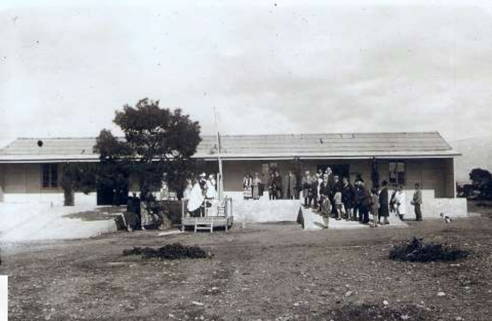
ΠΑΝΕΛΛΗΝΙΟΣ ΕΥΝΔΕΣΜΟΣ ΚΑΤΑ ΤΗΣ ΦΥΜΑΤΙΔΟΣΕΣ